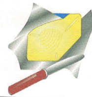
100 g beurre